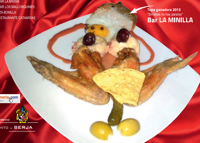
Tapa ganadora 2013 "Sin tetas no hay paraíso" Bar LA MINILLA